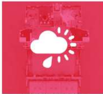
SAFETY AND RESILIENCE